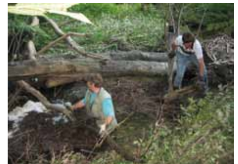
Död ved gynnar livet i vattendragen, här hade dock en stor propp bildats framför en kulvert efter en storm. Nätverket ryckte ut för att fixa!