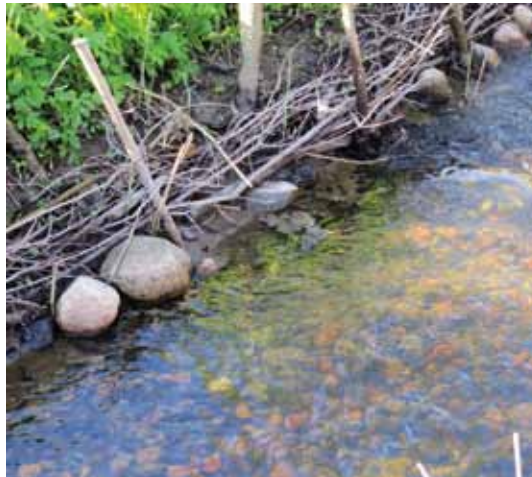
Lekplatsens kant har försetts med några slybuntar

En annan metod man provat med stor framgång är den från England ganska oprövade "Fagotts and Brushwood Bundles", ungefär "risknippen och slybuntar". För att öka och förändra strömmen, placerar man ut slybuntar av salix, björk och asp i bäckens kanter. Buntarna förankras med käppar och en ny strandbrink etableras successivt. Metoden lämpar sig väl i bäckar där man har problem med vass och vattenhastigheten är låg. Slybuntarna blir samtidigt fina gömslen och uppväxtmiljöer för yngel och insektslivet gynnas. Noterbart är att den nya strandbrinken etableras snabbt, på några få månader.